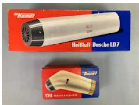
Heißluftdusche und Rasierapparat "Komet" VEB Elektrogerätewerke Suhl, nach 1971

Trotz des Sammlungsmoratoriums sind wir nach wie vor daran interessiert, Kunststoff-Objekte aus DDR-Fabrikationen zu übernehmen.