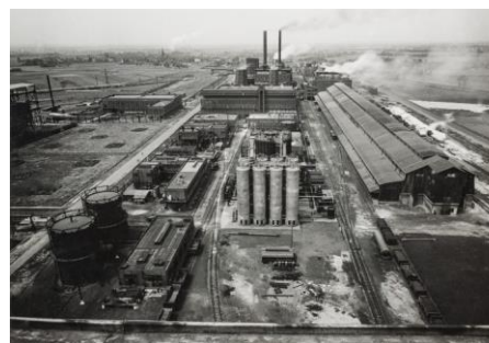
Foto: Albert Renger-Patzsch, Gesamtansicht, Ruhrchemie AG, um 1938, © LVR-Industriemuseum

Das LVR-Industriemuseum und die Ludwiggalerie Schloss Oberhausen zeigen den einzigartigen fotografischen Schatz aus dem Bestand der Ruhrchemie AG. Seit der Ansiedelung des Chemieunternehmens in Oberhausen-Holten 1928 haben zahlreiche Fotografen das Werk, die dort arbeitenden Menschen und die entstehenden Produkte abgelichtet. Neben den Arbeiten prominenter Fotografen, wie Albert Renger-Patzsch, Robert Häusser, Karl Hugo Schmölz, Carl August Stachelscheid oder Ludwig Windstosser, werden auch Fotografien weniger bekannter Fotografen in der Ausstellung zu sehen sein, die eine Unternehmensgeschichte der Ruhrchemie AG und ihrer Produktionsstätten in Bildern zeigen.